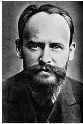
Christian Morgenstern 1871-1914

der Haselstrauch лещина der Spatz воробей Herzlein Gepoch стук сердца