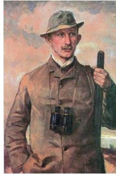
Hermann Löns 1866-1914

Auf den kalten, nassen Wegen Gehe ich mit leichtem Fuß , Wie ein Lied war mir dein Lächeln Und wie Sonnenschein dein Gruß.