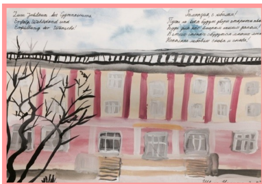
Швед Никита, 2в