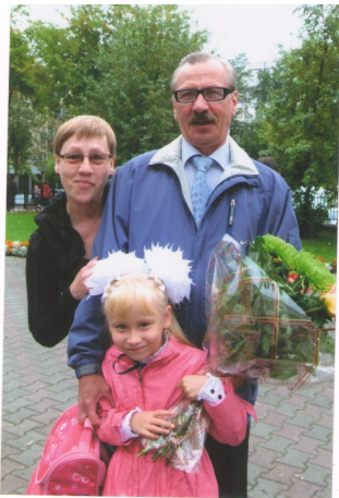
МОИ БАБУШКА И ДЕДУШКА