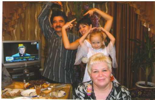
МОИ БАБУШКА И ДЕДУШКА