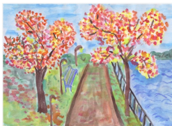
Рисунок Н. Гринёвой

23 октября в 3 «В» и 3 «D» классах прошел сказочный по красоте праздник осени «Краски осени» Ребята приготовили костюмы, показывали смешные сценки, пели песни и читали стихи. Как итог праздника была выпу-