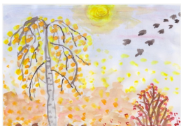
Рисунок А. Гаврилова

щена книга об осени, куда вошли рисунки и стихи детей.