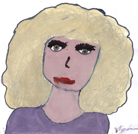
Рисунок Курбатовой Юлии, 3D класс