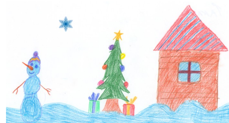
Рисунок Кошука Влада, 1а