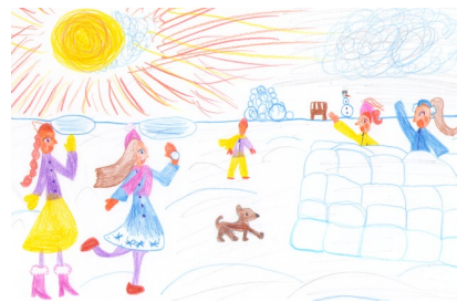
Рисунок Черемных Анны, 1а

Новый год - великолепный праздник, но к нему долго готовятся! Ставят елки и наряжают их свечами, игрушками, гирляндами и мишурой. На стены вешают новогодние носки для подарков. Но самое фантастическое в Новом году это Дед Мороз, который дарит подарки детям и взрослым. В эту ночь можно увидеть необыкновенно крупные звезды и маленькие снежинки, которые будто танцуют вальс.