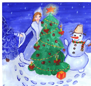
Рисунок Копытиной Анны, 2в