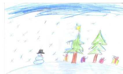
Рисунок Бенцель Мануэля, 2в