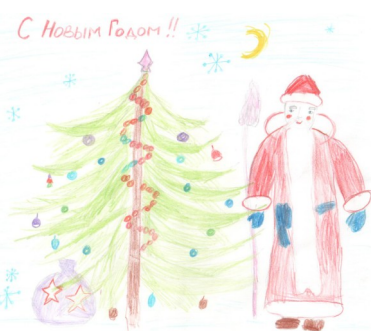
Рисунок Ковтун Вероники, 1в