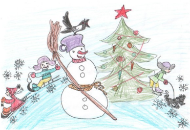
Гофман Григорий, 3в