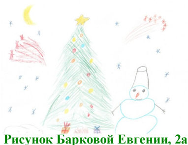
Рисунок Барковой Евгении, 2а