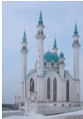
Мечеть Кул Шариф