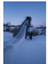
Колодко Олег, 3 д