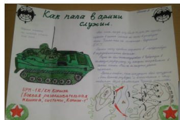
Пепина А, 3с