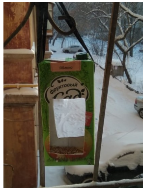
Работа Чикилева Степана